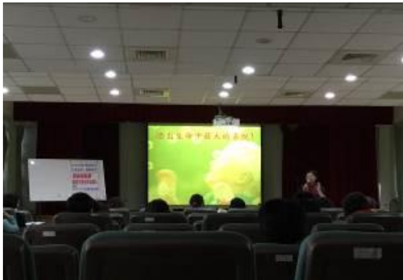
▲父母的正向能量才能帶給孩子樂觀不畏艱難的能量