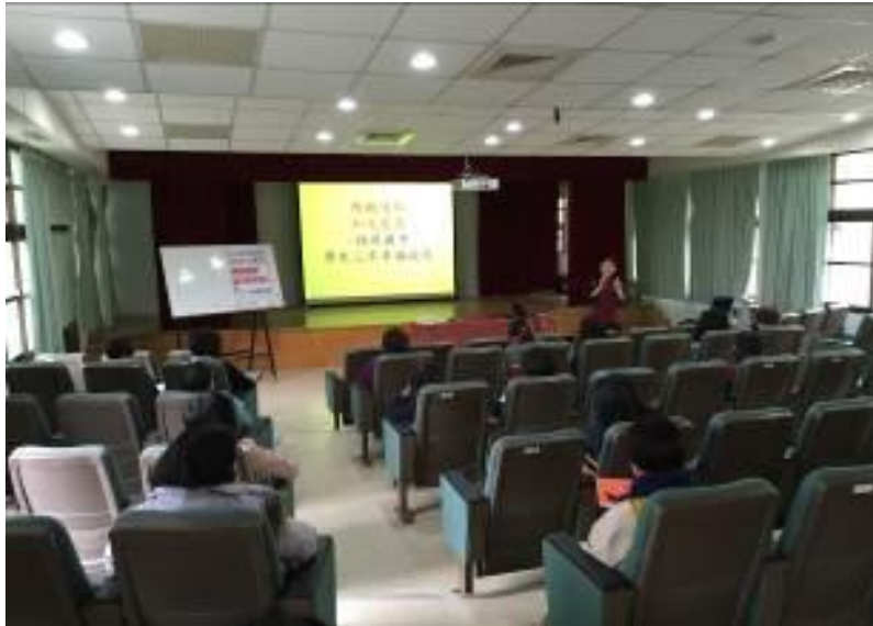
▲美英老師到培英國中為家長辦理講座