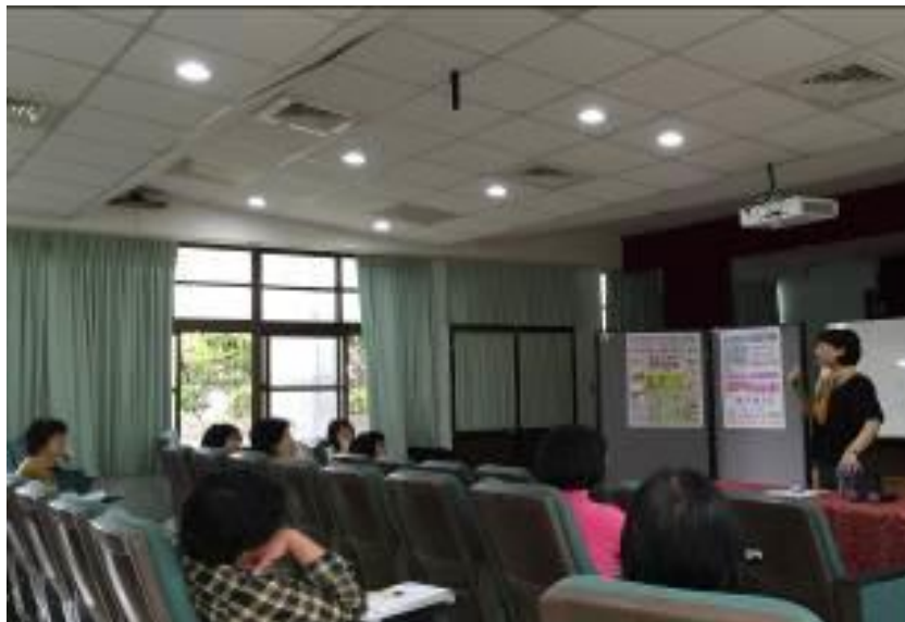
▲溫馨的家庭關係帶給孩子正向成長的環境與力量