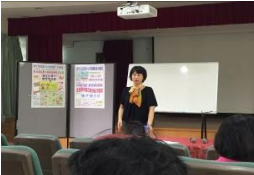
▲子蘭老師在家庭與兒童發展上有長久的研究