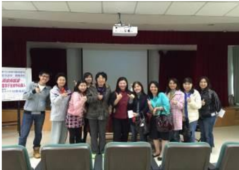
▲溫暖有趣的風格，讓家長備感溫馨