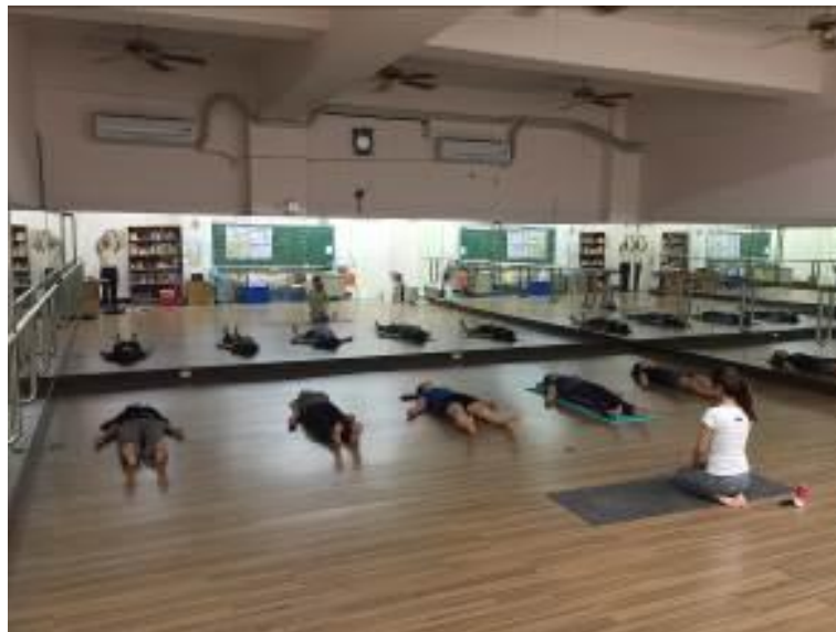
▲心靈淨化，在音樂饗宴中沉澱