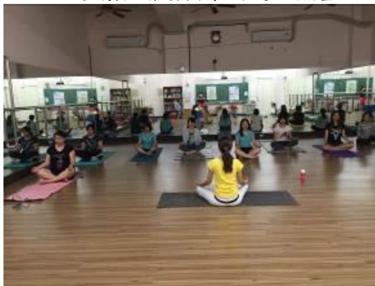
▲靜思冥想，情緒會找到更好的出口