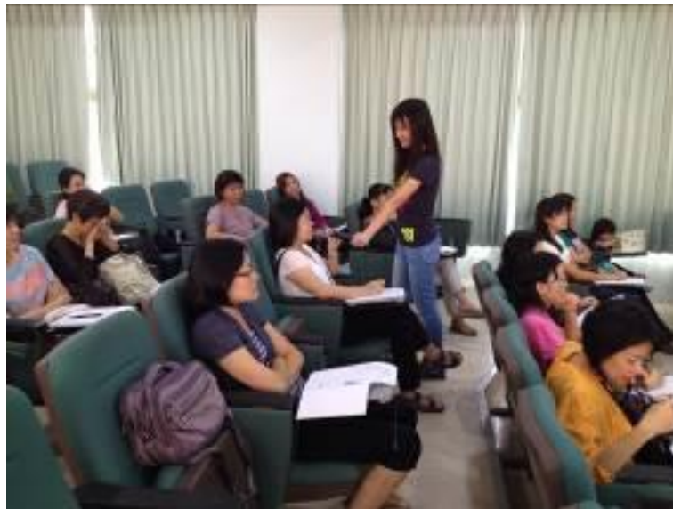
▲講師和學員的第一次親密接觸