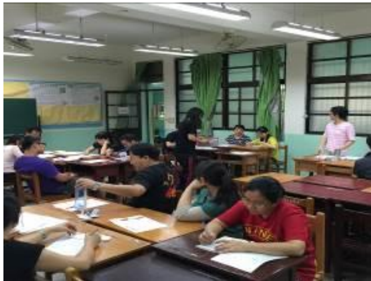
▲心靈成長，溝通與分享，重建正向能量