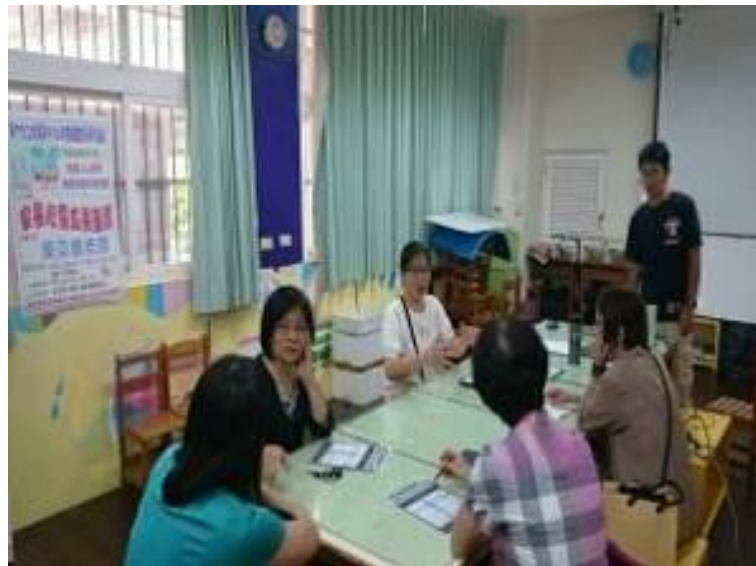
▲家長們的分享時光