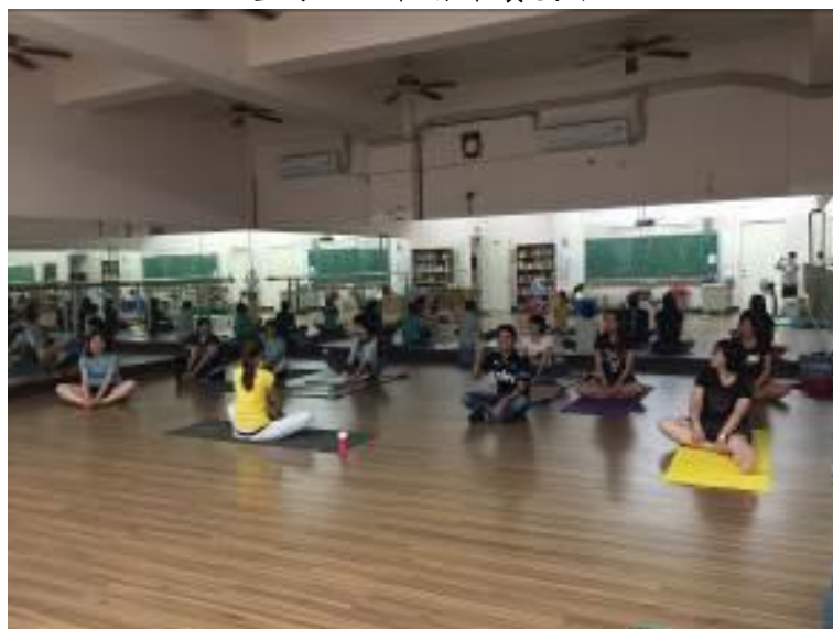
▲聆聽身體的旋律，身心靈舒壓