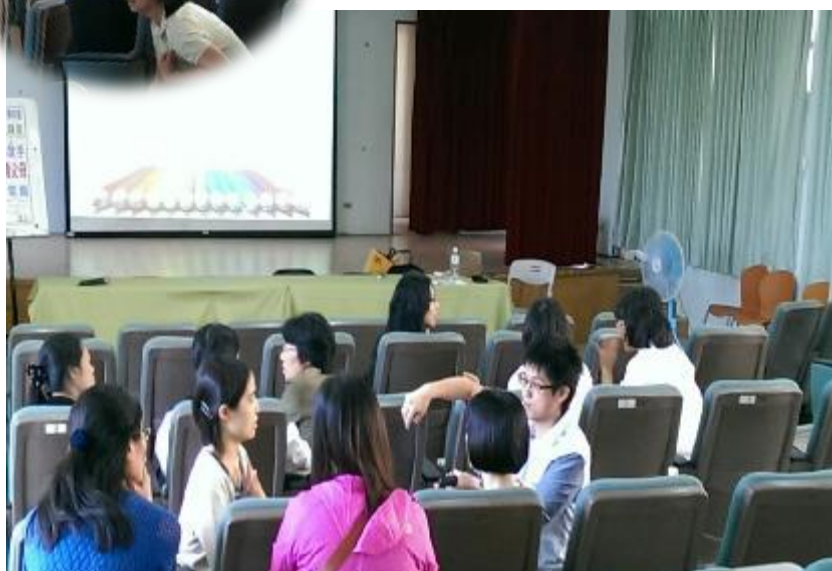
▲家長們熱烈回應提出問題，講師也與家長們的互動非常良好