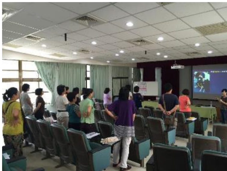
▲講師和家長互動良好