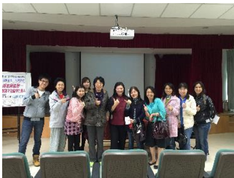
▲演講後，家長們熱情的和老師討論問題，並合影留念