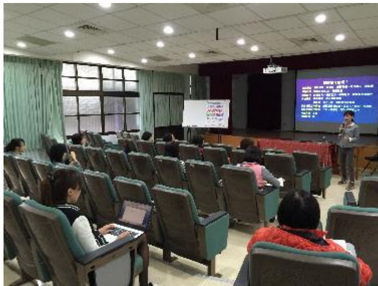
▲凡奇老師的演講受到家長們熱烈的迴響