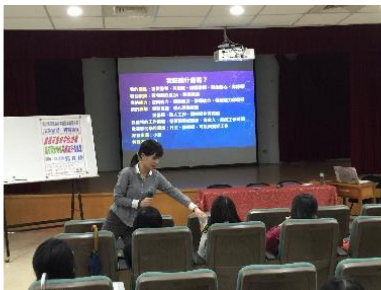
▲演講內容精采豐富，講師和家長有良好的互動