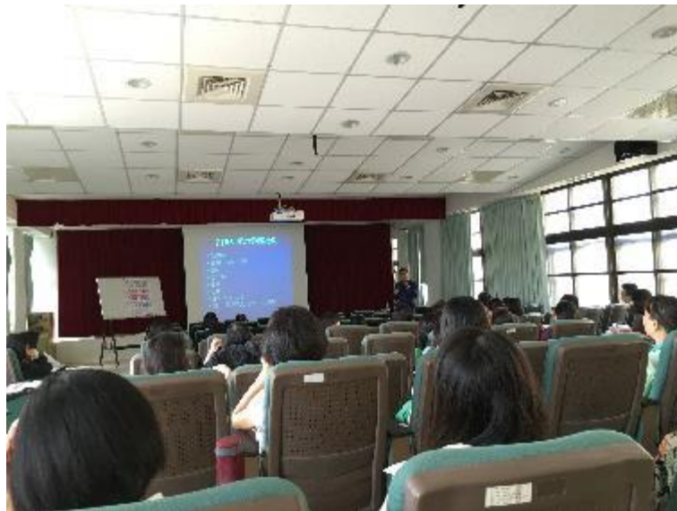
▲報名的家長非常踴躍