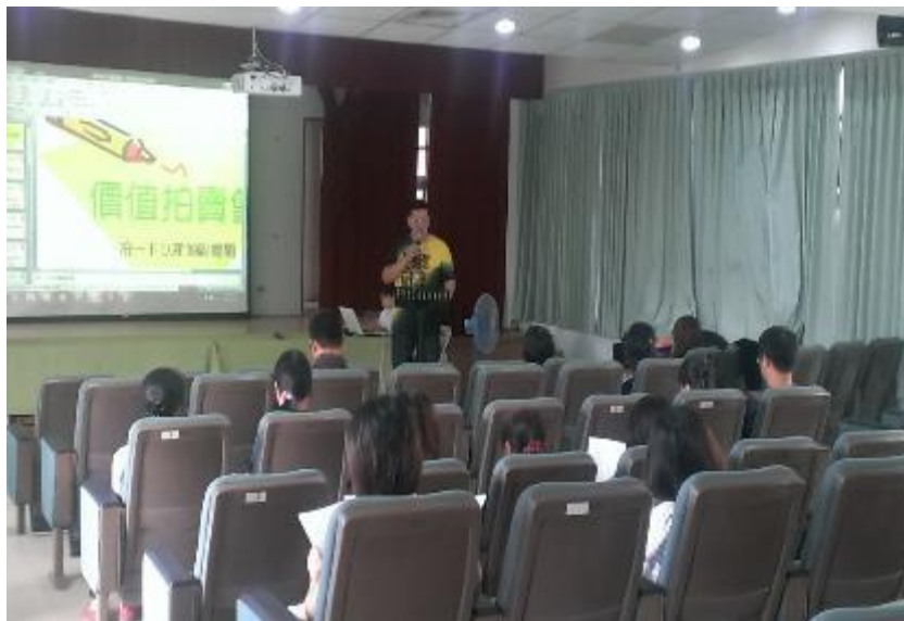
▲王牧師的講題，引家長們的興趣