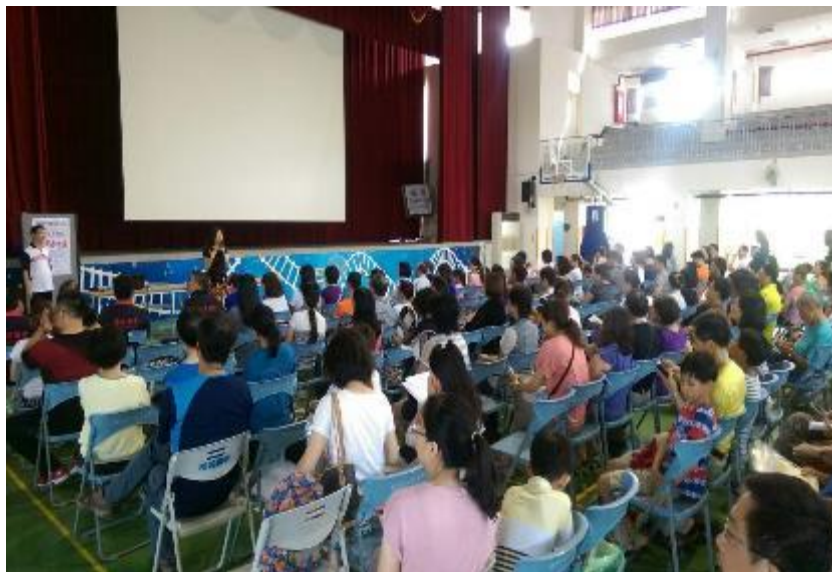
▲家長參加的人數相當的踴躍，由校長親自開場主持