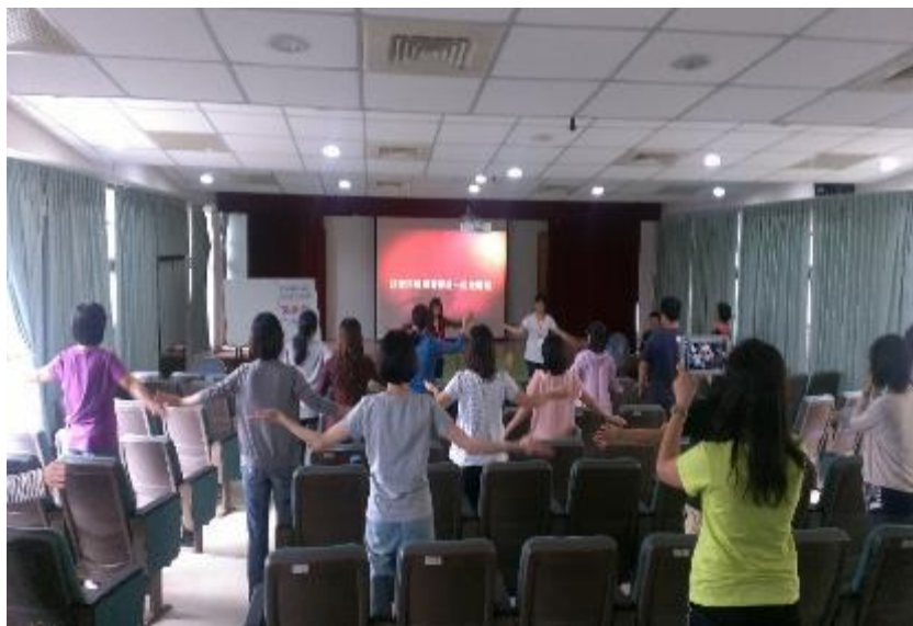
▲家長也和牧師互動