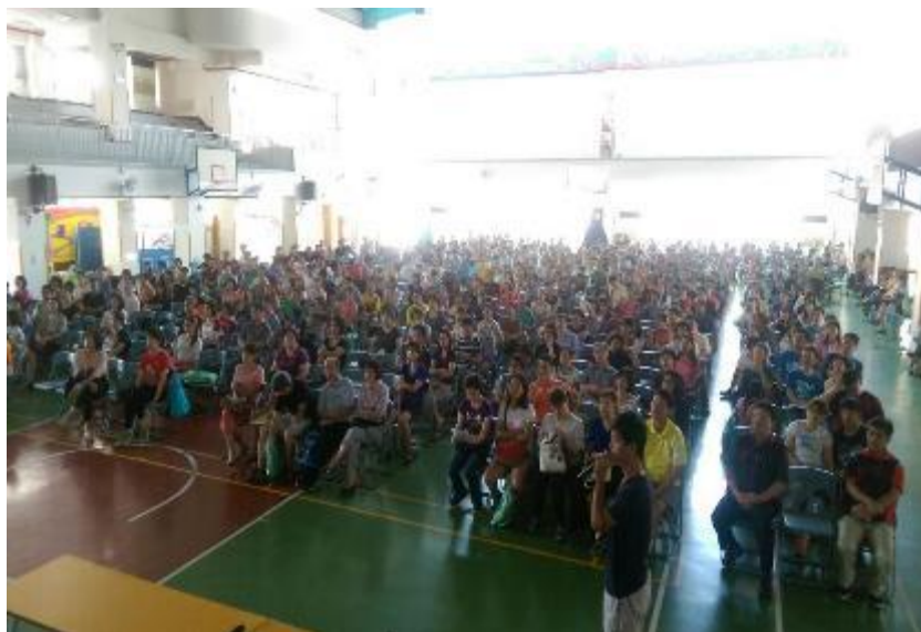
▲家長們都非常關心自己即將步入國中生涯的孩子-座無虛席