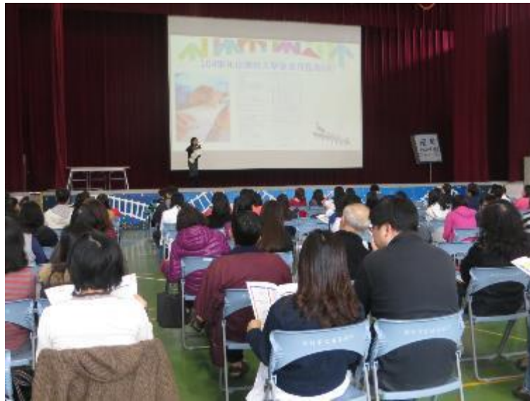
▲孩子的未來每個家長都非常的關心