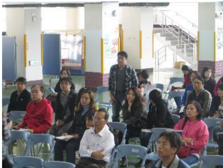
▲家長報名都很踴躍，且專注聆聽