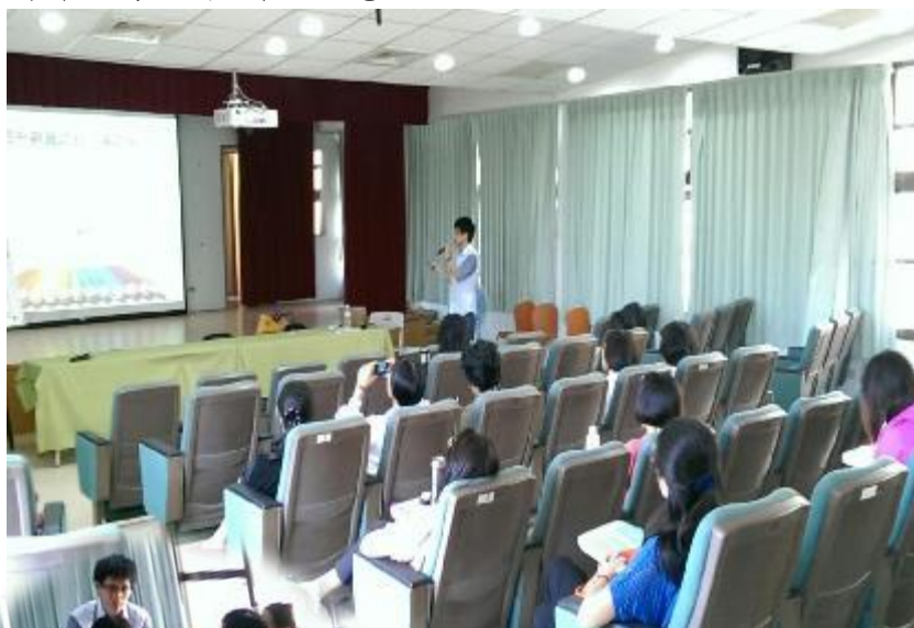
▲克振老師演講場場深受家長們的喜愛