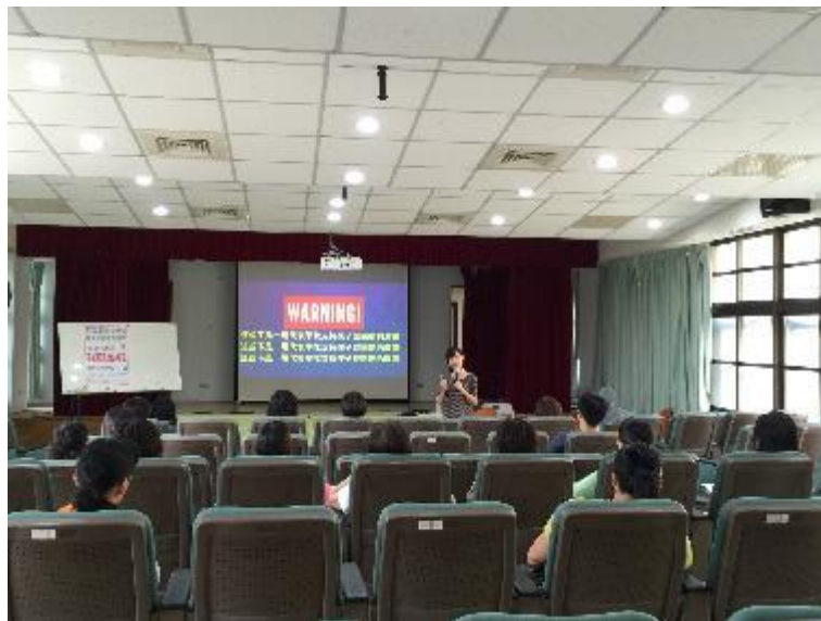
▲凡琦心理師的演講一向受到家長的歡迎