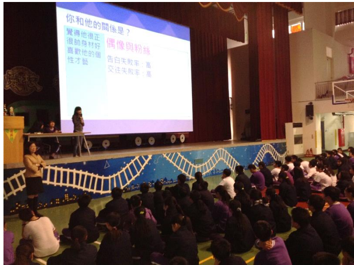
講師演講活潑生動