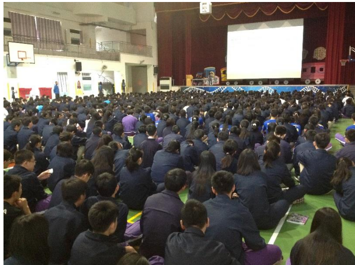
參與學生非常的多