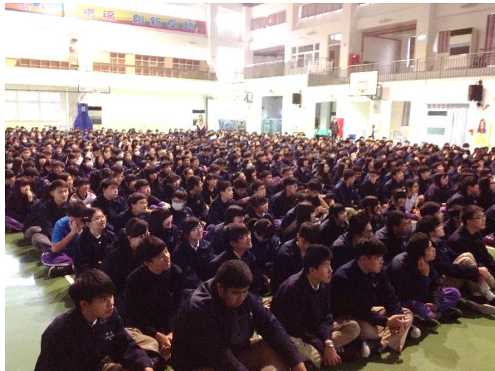
同學們認真聆聽 表情專注