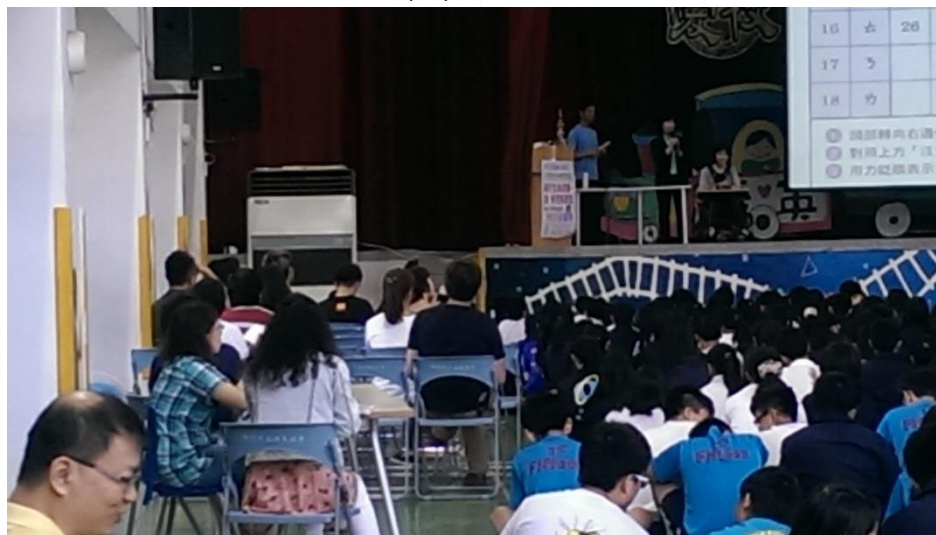
學校師生家長踴躍參與活動