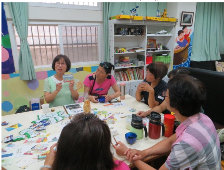
志工媽媽們熱烈討論事項