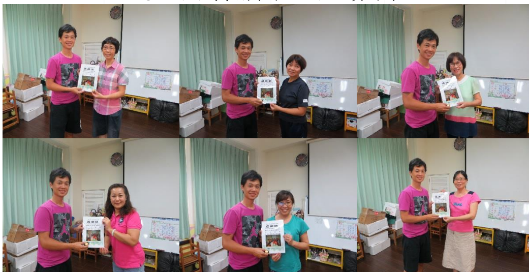
主任頒發感謝狀 謝謝志工媽媽一學期的辛苦