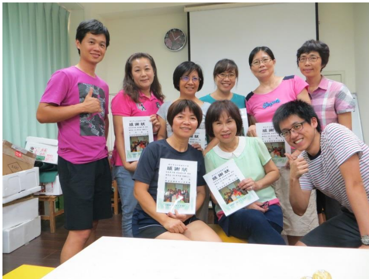
主任和志工媽媽們合影