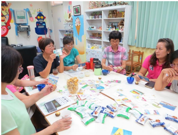
志工媽媽們學期末了 依然認真研討